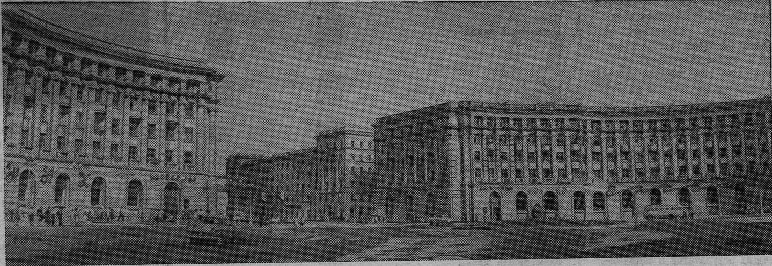
НОРИЛЬСК СЕГОДНЯ. На снимке: Гвардейская площадь заполярного города.