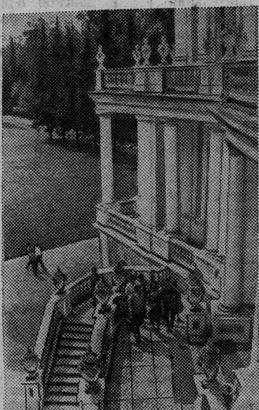
ЛЕНИНГРАДСКАЯ ОБЛАСТЬ. Хороши пригороды Ленинграда. Здесь проводят свой выходной день тысячи людей.