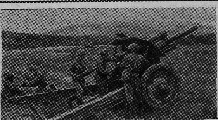
Новыми успехами в боевой учебе встречают артиллеристы Н-ской части пятидесятилетие Великого Октября. НА СНИМКЕ: на огневой позиции отличный комсомольский оружейный расчет.

На конверте или на обратной стороне фотоснимка ставьте пометку «На фотоконкурс». Снимки не рецензируются и не возвращаются.