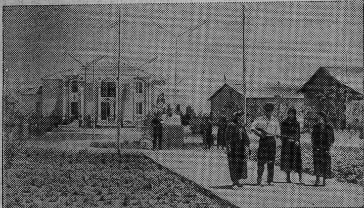
Сквер в поселке колхоза «Мир» Ашхабадского района. Слева здание клуба.