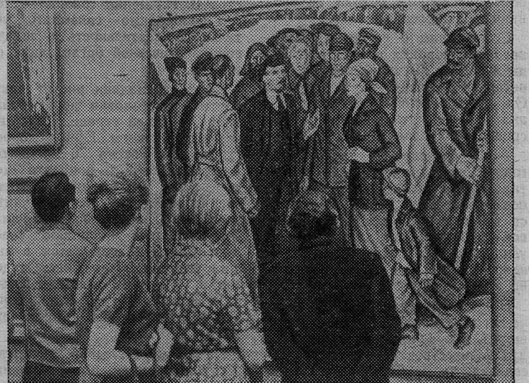
«ХУДОЖНИКИ МОСКВЫ — 50-ЛЕТИЮ ОКТЯБРЯ» — так называется выставка, открывшаяся в Москве.

НА СНИМКЕ: у картины М. Никонова «Ленин с народом».