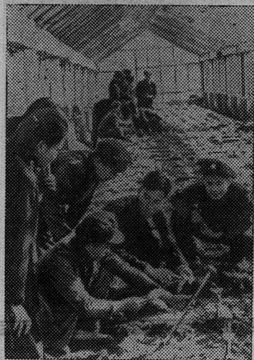
Корейская Народная Демократическая Республика. Студенты Байчунской высшей сельскохозяйственной школы в провинции Южный Хванхе на практических занятиях в теплице.