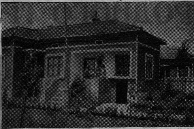
Новые дома крестьян в селе Божурово Толбухинского округа (Болгария).