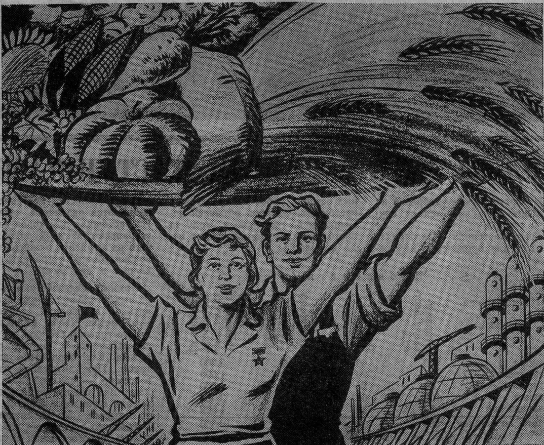
Плакат Ю. Иванова.