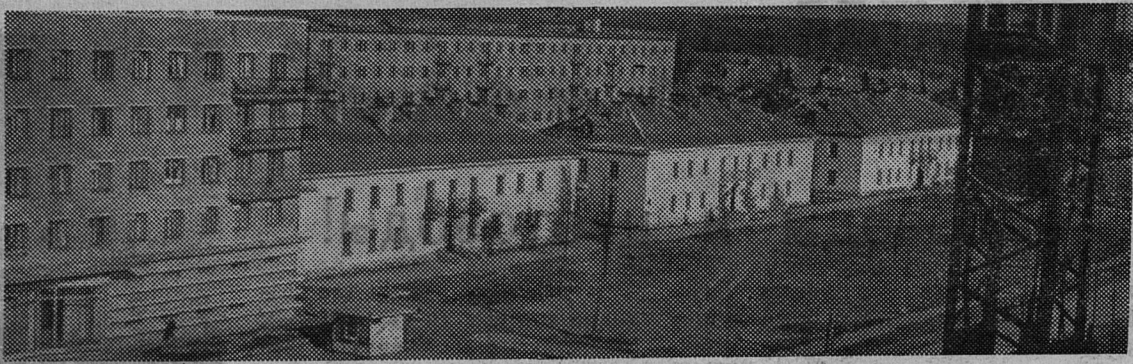
УЛИЦА ЛЕНИНА. На втором плане новый дом для рабочих регенератного завода.