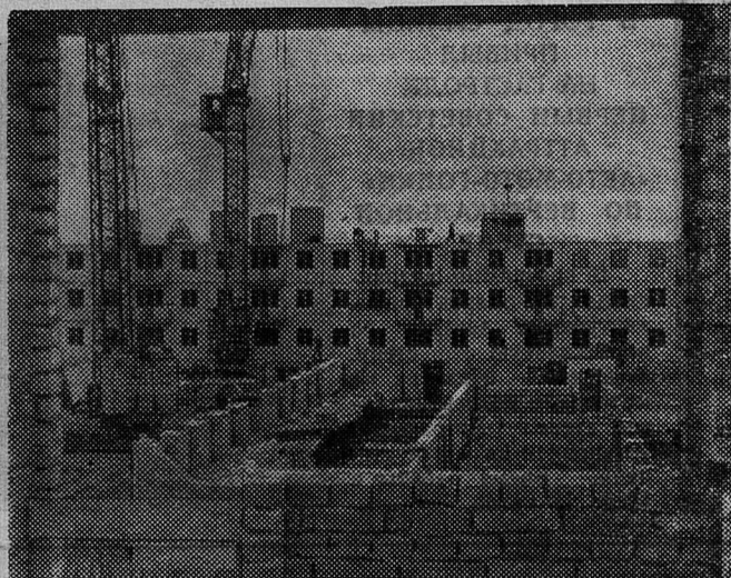
Вчера был фундамент, сегодня — этаж... Так рос этот дом по улице Кирова. Сейчас все пять этажей подведены под крышу.

— Этого потребовало общество охраны животных.