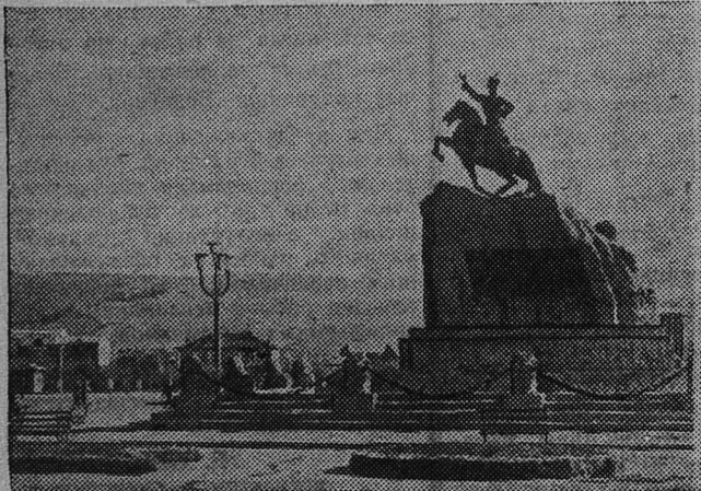
Улан-Батор сегодня. Памятник национальному герою Монголии Сухэ-Батору.

АДРЕС РЕДАКЦИИ: гор. Сланцы, Банковская ул., дом № 3. ТЕЛЕФОНЫ: редактора — 23-20, зам. редактора и отв. секретаря — 23-25, отделов: промышленности — 23-25, писем и массовой работы — 23-66, сельского хозяйства — 21-85. Объявления принимаются в бухгалтерии редакции.