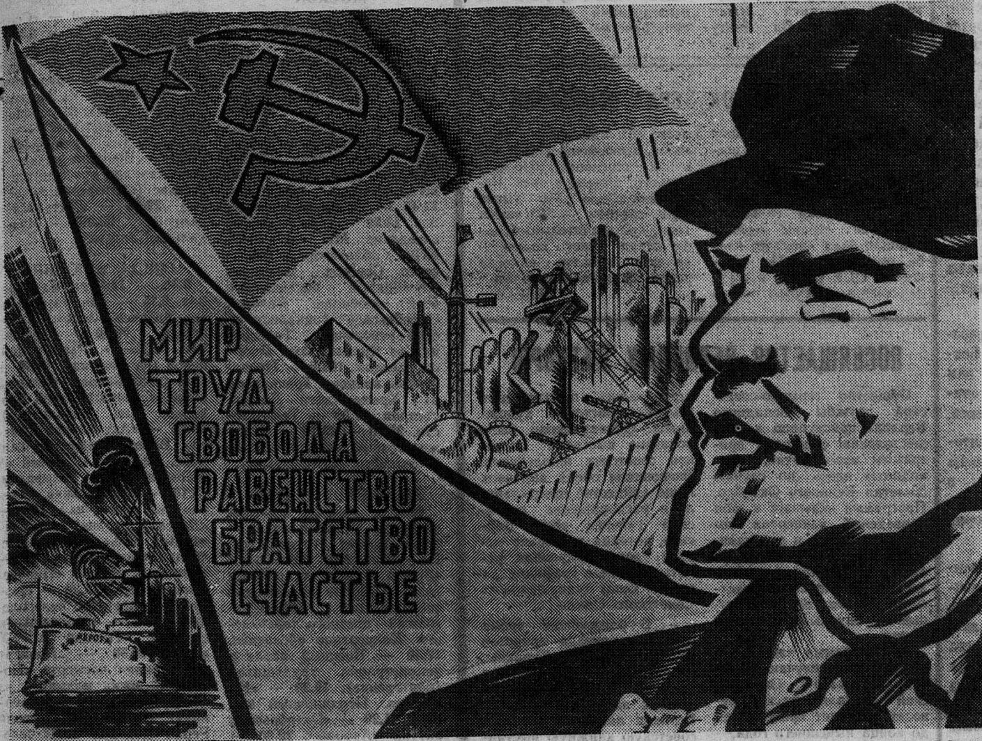
Плакат Ю. Иванова.