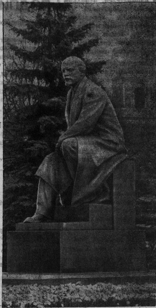
ПАМЯТНИК В. И. ЛЕНИНУ В КРЕМЛЕ, ТОРЖЕСТВЕННО ОТКРЫТЫЙ 2 НОЯБРЯ 1967 ГОДА.