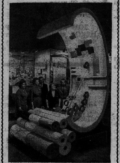
В Доме технической пропаганды открылась выставка «Ленинградская промышленность за 50 лет». Со дня победы Великого Октября город-колыбель пролетарской революции превратился в гигантский «экспериментальный цех» индустрии Советской страны. Сегодняшний Ленинград всего за пять дней дает столько продукции, сколько дореволюционный Петроград выпускал за год.