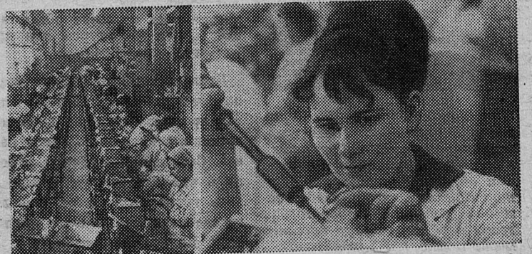
Каждый день с конвейера сборочного цеха новосибирского радиозавода «Электросигнал» сходит 400—500 телевизоров «Изумруд».