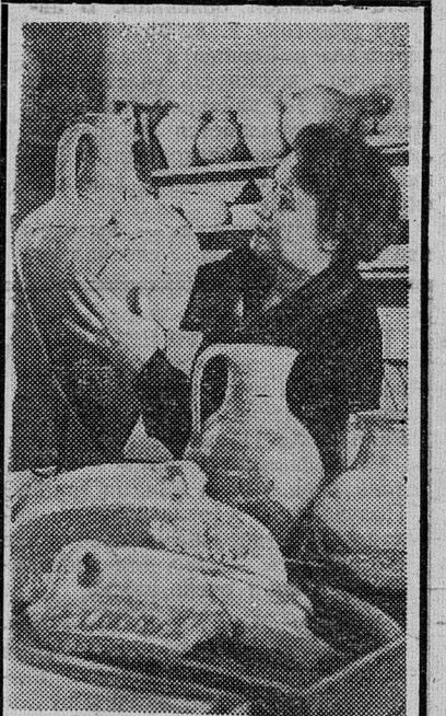
В археологических изысканиях ежегодно участвуют экспедиции и отряды ученых Ленинградского отделения института археологии Академии наук СССР.

Перед медицинской службой Англии встает неотложная проблема — остановить тревожный рост числа наркоманов в стране. Нью-Йоркский юридический институт опубликовал доклад, в котором сообщается, что при нынешних темпах роста число наркоманов, официально зарегистрированных в Англии, достигнет к 1972 году 11.000 человек. Никто, однако, не знает числа тех, на кого еще не заведены регистрационные карточки в больницах.