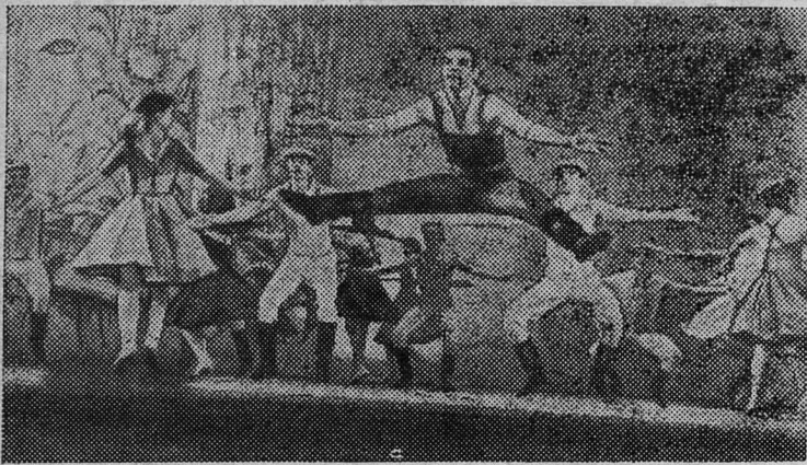
ЛЕНИНГРАД. Здесь состоялся заключительный тур фестиваля самодеятельного искусства.

НА СНИМКЕ: сцена из хореографической миниатюры «Озорные частушки» Р. Щедрина в исполнении артистов балета народного театра Дворца культуры имени С. М. Кирова.