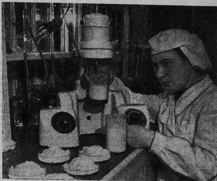
Невельский молочно-консервный завод Псковской области освоил технологию производства сухого мороженого в порошке. Оно чрезвычайно удобно для транспортировки. Уже в юбилейном году невельцы выпустят 7 тонн этой вкусной и питательной продукции.

Большую помощь медицинским работникам в наведении санитарного порядка оказывают общественные инспекторы, которые осуществляют контроль за содержанием жилых домов, парикмахер-