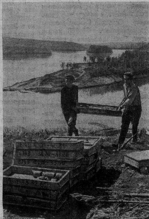
НА КРУПНЕЙШИХ СТРОЙКАХ СИБИРИ

Во многих партийных организациях сейчас заведен такой порядок: секретарь, хозяйственные ру-