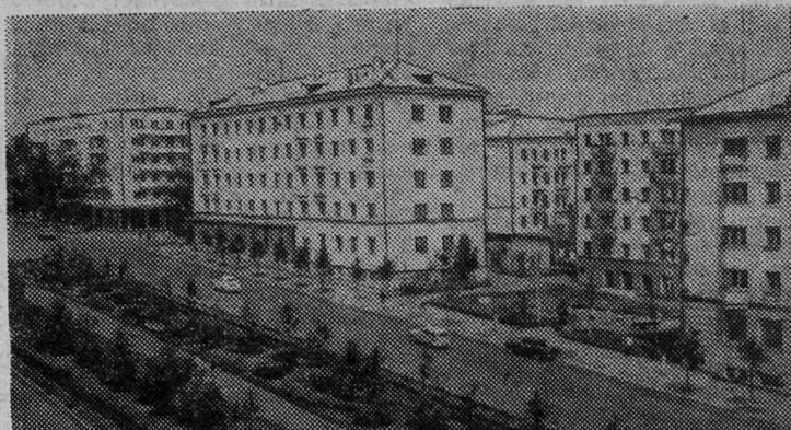
На родине В. И. Ленина — Ульяновске сегодня. Новые жилые дома на главной магистрали города — улице Гончарова.