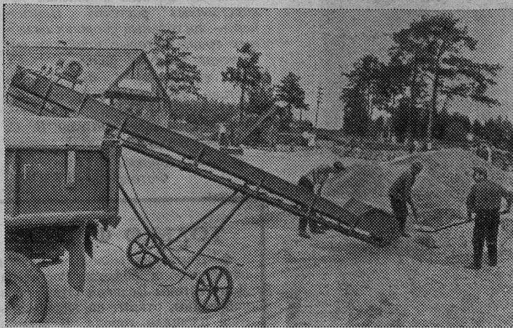
Снимок сделан на току колхоза «Заря» Починковского района

Смоленской области. Это хозяйство получило по 20—23 центнера