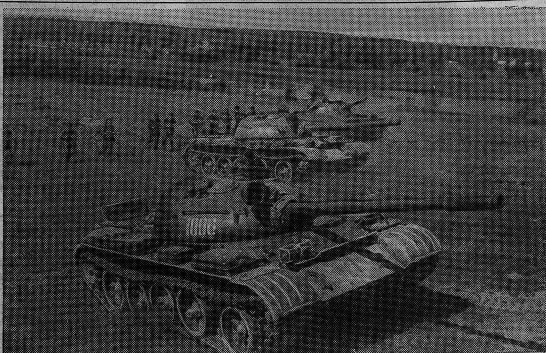
Танки во взаимодействии с пехотой идут в атаку.

Из 900 гектаров зерновых в совхозе «Старопольский» убрано 744 га.