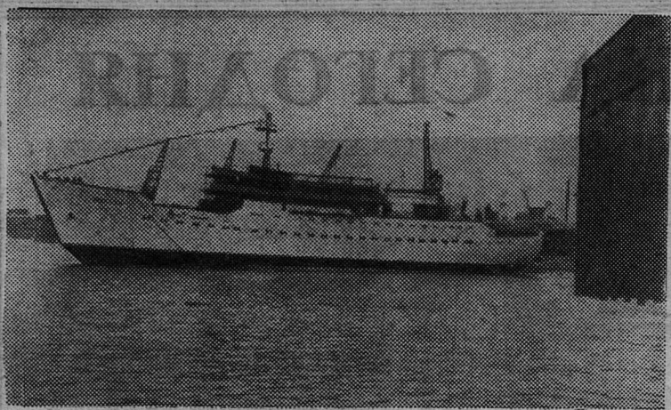
Это судно «Муссон», построенное по заказу Советского Союза шведскими судостроителями (Польша). Оно предназначено для океанологических и метеорологических исследований.

НЕМНОГИМ более трех месяцев назад, 12 июня 1967 года, новая советская автоматическая межпланетная станция «Венера-4» начала свой полет к Венере.