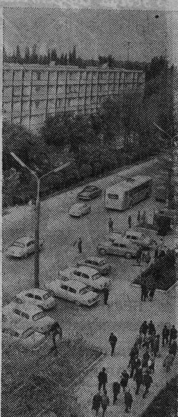
ФРУНЗЕ. Главная магистраль города — улица имени XXII партсъезда.