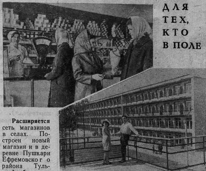
Расширяется сеть магазинов в селах. Построен новый магазин и в деревне Пушкина Ефремовского района Тульской области.

ОТ РЕДАКЦИИ: Мы обращаемся к нашим читателям с просьбой продолжить разговор. А каково ваше мнение об услугах бытпрома комбината, их качестве, культуре обслуживания, сроках? Какими новыми видами и формами услуг вы хотели бы пользоваться? Напишите нам об этом. Это поможет работникам комбината улучшить ваше обслуживание.