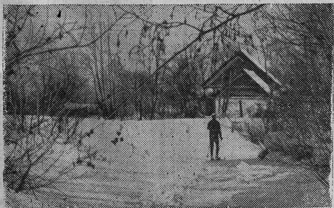
В ЗИМНЕМ ЛЕСУ.

Зачем?! К чему?! Да просто так, для плана. Пусть Лоси Подадут за это в суд На бесхозяйственность Медведя-формалиста... Ведь «галочка» стоит, И в этом суть! Попробуй, обвиненье выставь! У нас еще Встречается Медведь (Я кой-кого имею на примете)... Пусть позаботится О людях впредь, А не о «галке» в смете!