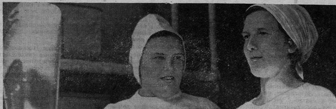
Сегодня — праздник работников пищевой промышленности

В день праздника желаем трудящимся сланцевских предприятий пищевой промышленности новых успехов в их благородном и почетном труде, отличного здоровья и счастья в личной жизни, достойно встретить 50-летие Великого Октября.