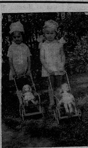
ПЕРВАЯ ЗАБОТА.