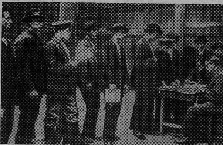
ФОТОДОКУМЕНТЫ ИЗ ИСТОРИИ ВЕЛИКОГО ОКТЯБРЯ

Указ вводится в действие с 1 ноября 1967 года.