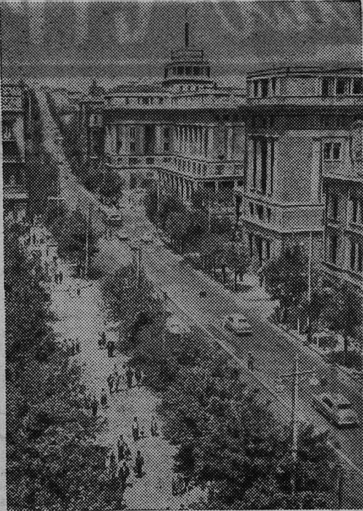
Город Баку, столица Азербайджана.

Ответственные обязательства приняли азербайджанские нефтяники. Они дали слово досрочно выполнить годовой план добычи нефти, выработать к 1 ноября сверхплановой продукции на 500 тысяч рублей и до конца года — на 600 тысяч рублей, осуществить мероприятия по обустройству