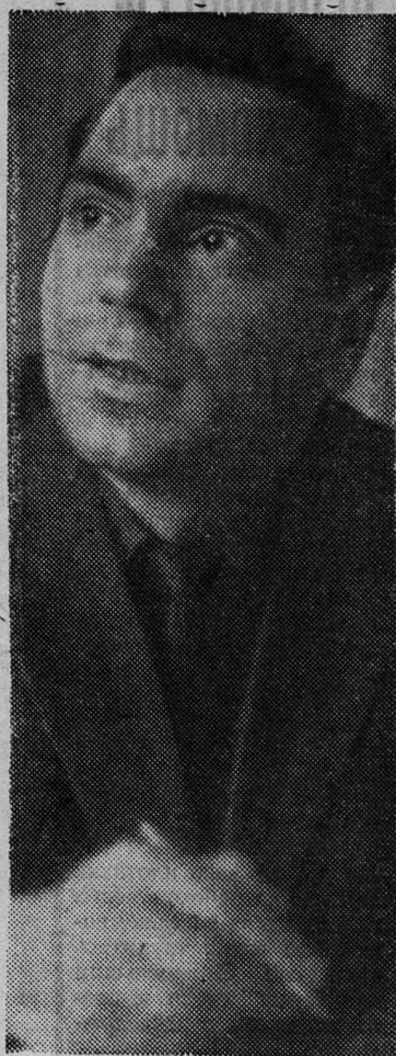
Никакие ухищрения преступника не помогают ему уйти от разоблачения, когда за дело берется начальник отдела уголовного розыска Кузьма Яковлевич Шикин.