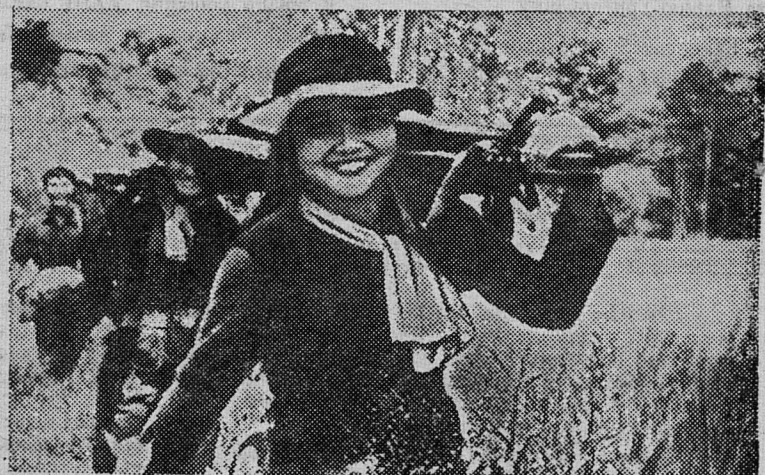
ЮЖНЫЙ ВЬЕТНАМ. Женщины-бойцы армии Освобождения возвращаются с боевого задания.