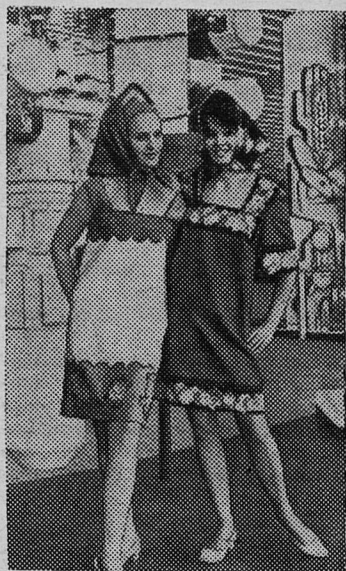
На Всемирной выставке «ЭКСПО-67» в Монреале советские манекенщицы показывают модели, созданные по национальным мотивам.

секретарь комсомольской организации шахты № 2.