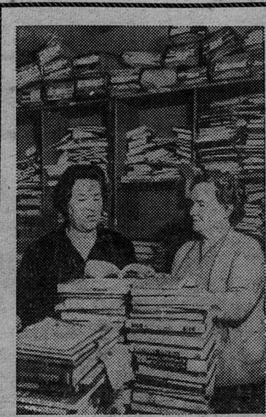
Москва. 35 лет существует центральный коллектор научных библиотек. Его дружный