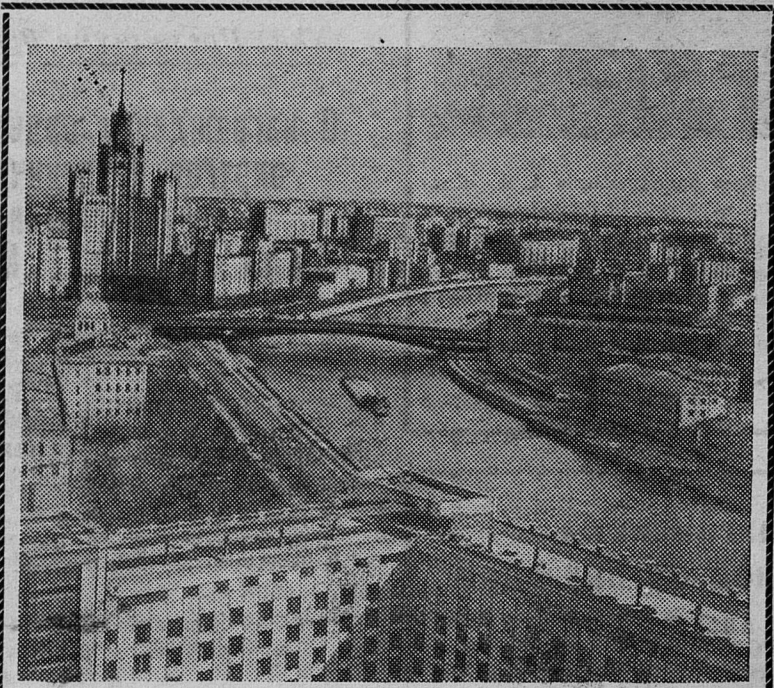
Москва сегодня. Вид на Москворецкую и Котельническую набережные с гостиницы «Россия».

А. ТИМОХОВИЧ, заведующая сберегательной кассой.