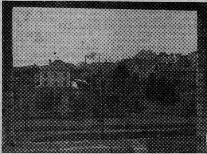
Наш город сегодня. Вид на улицу М. Горького.