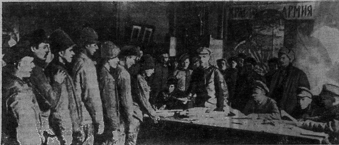
НА СНИМКЕ: раздача анкет для приема в Красную Армию.