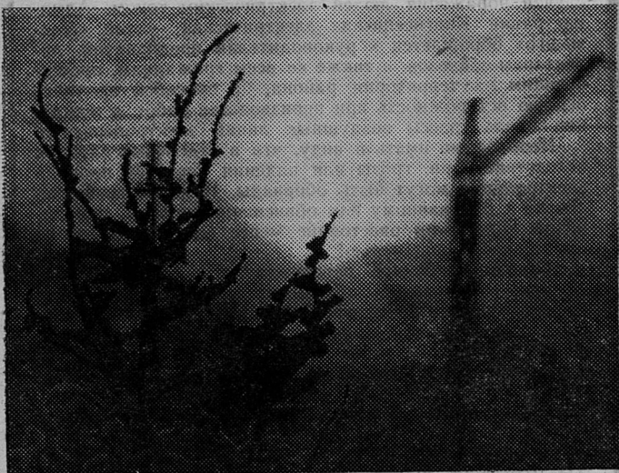
НАЧИНАЮЩИЙСЯ ДЕНЬ.