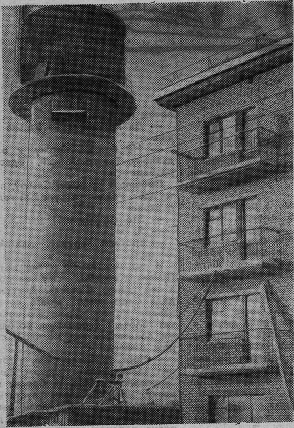
На центральной усадьбе совхоза «Сланцевский» подходит к концу строительство водонапорной башни, которая дает воду в новые дома рабочих совхоза. НА СНИМКЕ: новая водонапорная башня.