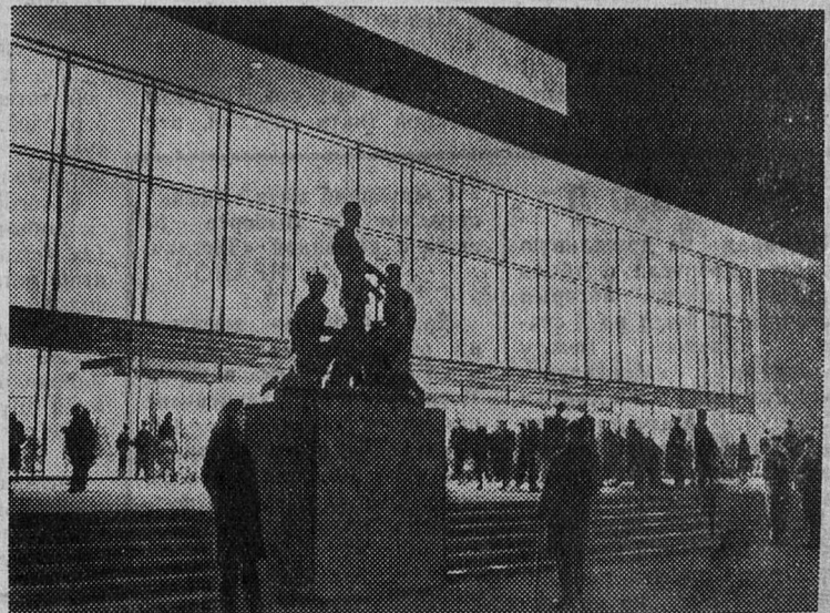
У концертного зала «Октябрьский».

Открытие театра состоялось в 1832 году. Его монументальный фасад украшен шестью коринф-