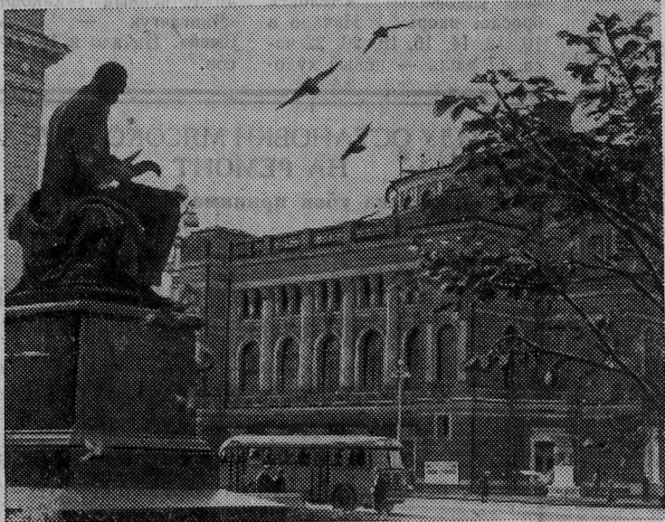
Театральная площадь. Вид на театр оперы и балета имени С. М. Кирова.

скими колоннами, статуями муз Терпсихоры и Мельпомены, скульптурами Славы и колесницей Аполлона, вычеканенной из листовой меди. Удивительно красив и гармоничен зрительный зал.