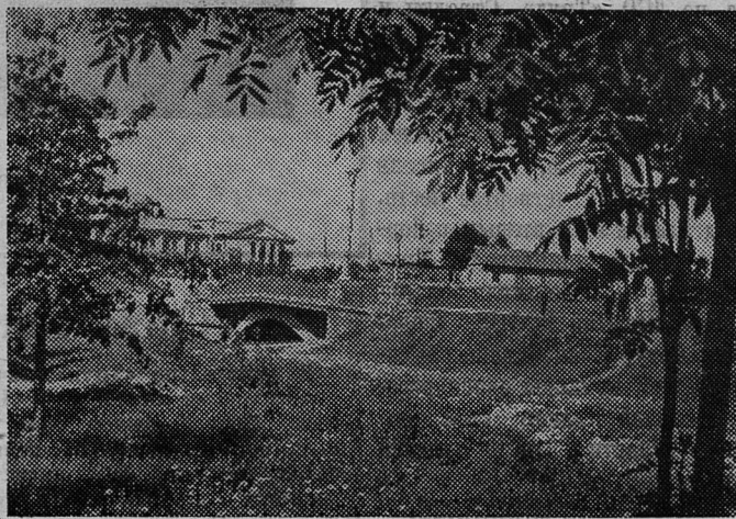
А там, под мостом, течет Плюсса.