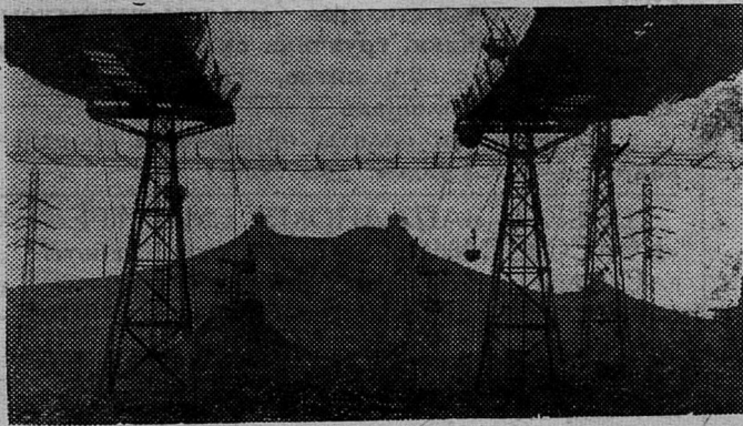
КАНАТНЫЕ ДОРОГИ.

Сорок тонн грубых кормов заготовили и высушили на ределях работники Сланцевского лесопункта в подшефном пятом отделении совхоза «Старопольский».