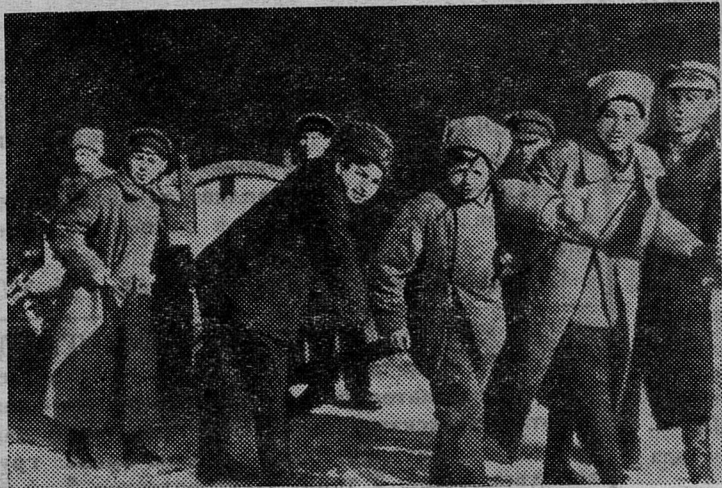
Комсомольцы были зачинщиками общественных мероприятий. На снимке показана группа активистов РКСМ за работой по очистке улиц Петрограда в 1920 году.