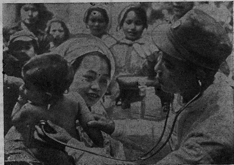
Демократическая Республика Вьетнам. Врачи пограничных застав в провинции Нгеань оказывают регулярную медицинскую помощь населению близлежащих районов.

Г. ИЛЬИН, наш общественный корреспондент.