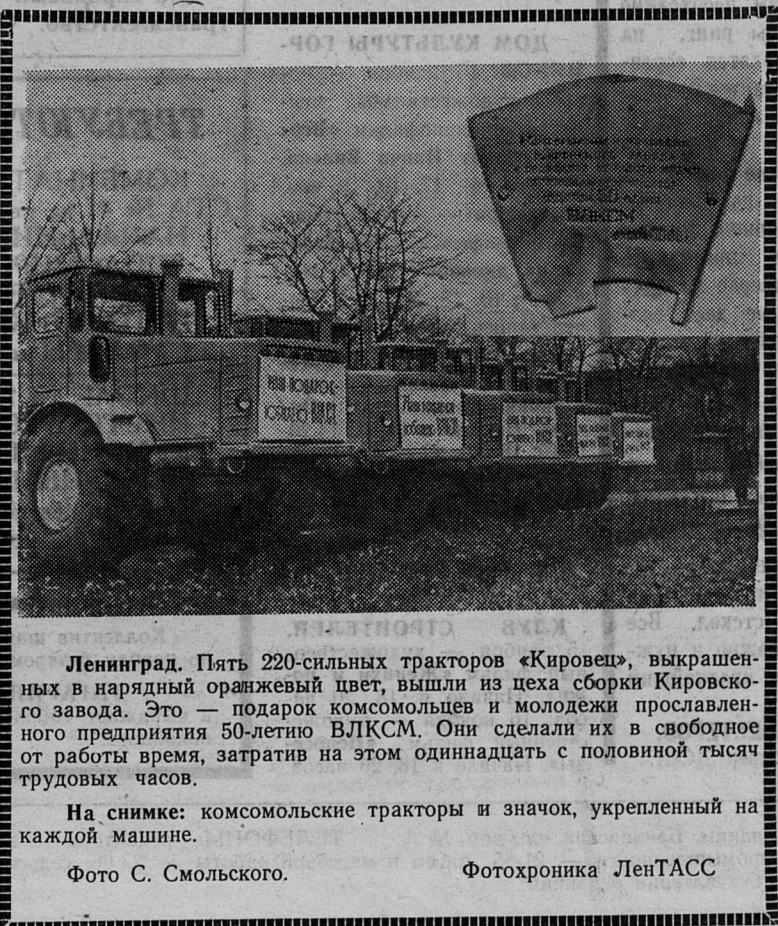
Ленинград. Пять 220-сильных тракторов «Кировец», выкрашенных в нарядный оранжевый цвет, вышли из цеха сборки Кировского завода. Это — подарок комсомольцев и молодежи прославленного предприятия 50-летию ВЛКСМ. Они сделали их в свободное от работы время, затратив на этом одиннадцать с половиной тысяч трудовых часов.