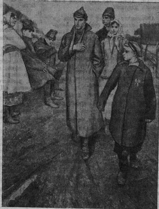
В Москве открыта всесоюзная художественная выставка, посвященная комсомолу. Она как бы подводит итог более ста выставкам, проходившим в столицах союзных республик, краевых и областных центрах страны. В Москве собраны работы 750 молодых художников и их учителей — известных мастеров изобразительного искусства.