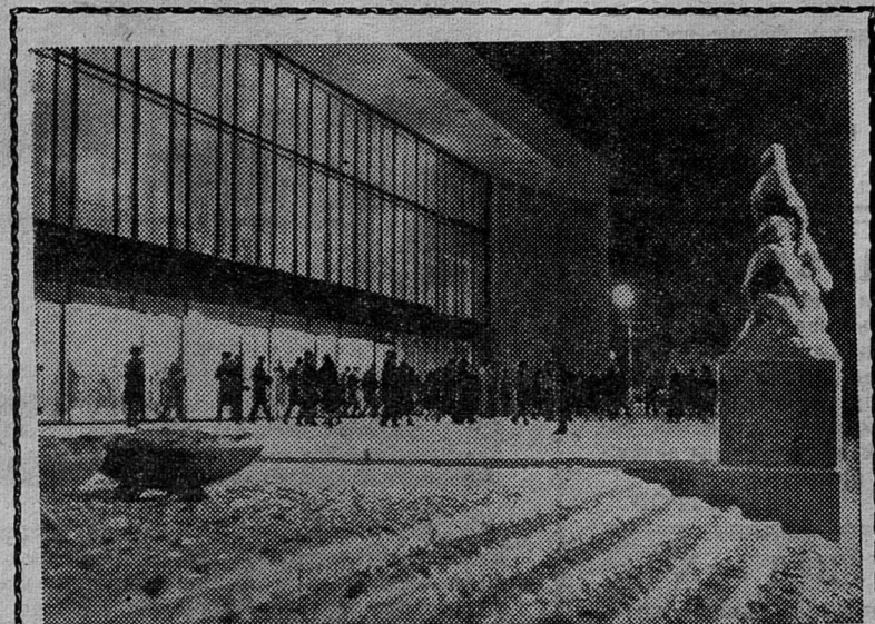
ЛЕНИНГРАД. Вечером у концертного зала «Октябрьский».