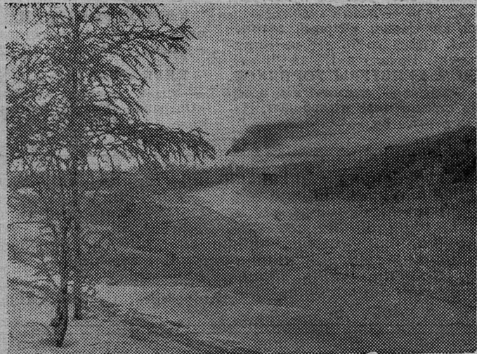
ВИД РЕКИ ПЛЮССЫ.