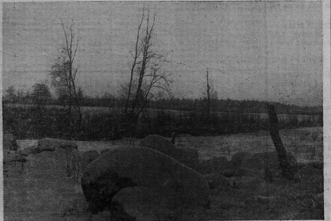
Валуны — немые свидетели времен ледникового периода.