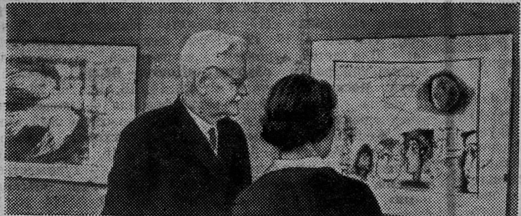
В Эрмитаже открылась выставка эстампов Пабло Пикассо, подаренных музеем старейшим французским коллекционером Даниелем Канвейлером. Все двадцать оттисков подписаны художником.