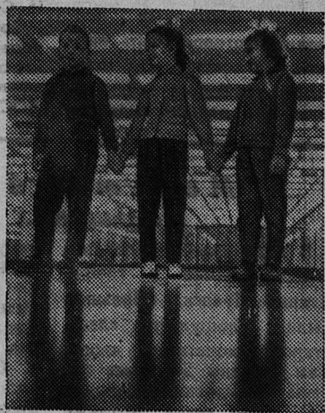
Курский камвольно-трикотажный комбинат приступил к выпуску продукции — женских платьев, кофт, костюмов, мужских рубашек, детских костюмчиков различных фасонов и расцветок. Торговые эксперты признали, что продукция — отличного качества.