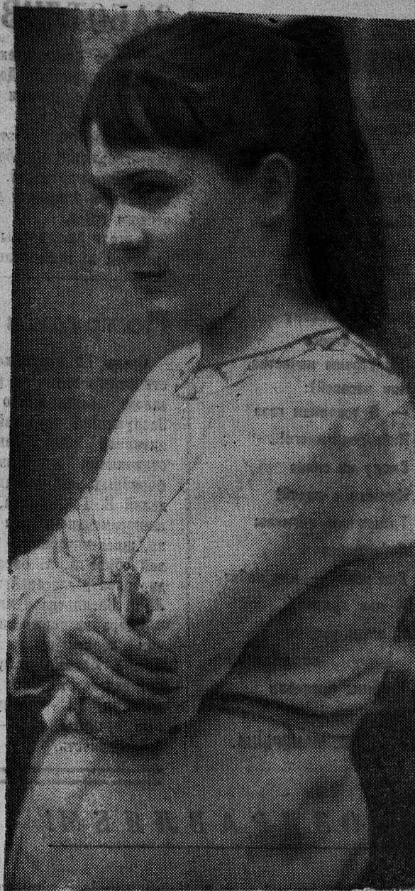
Перед выходом на сцену...