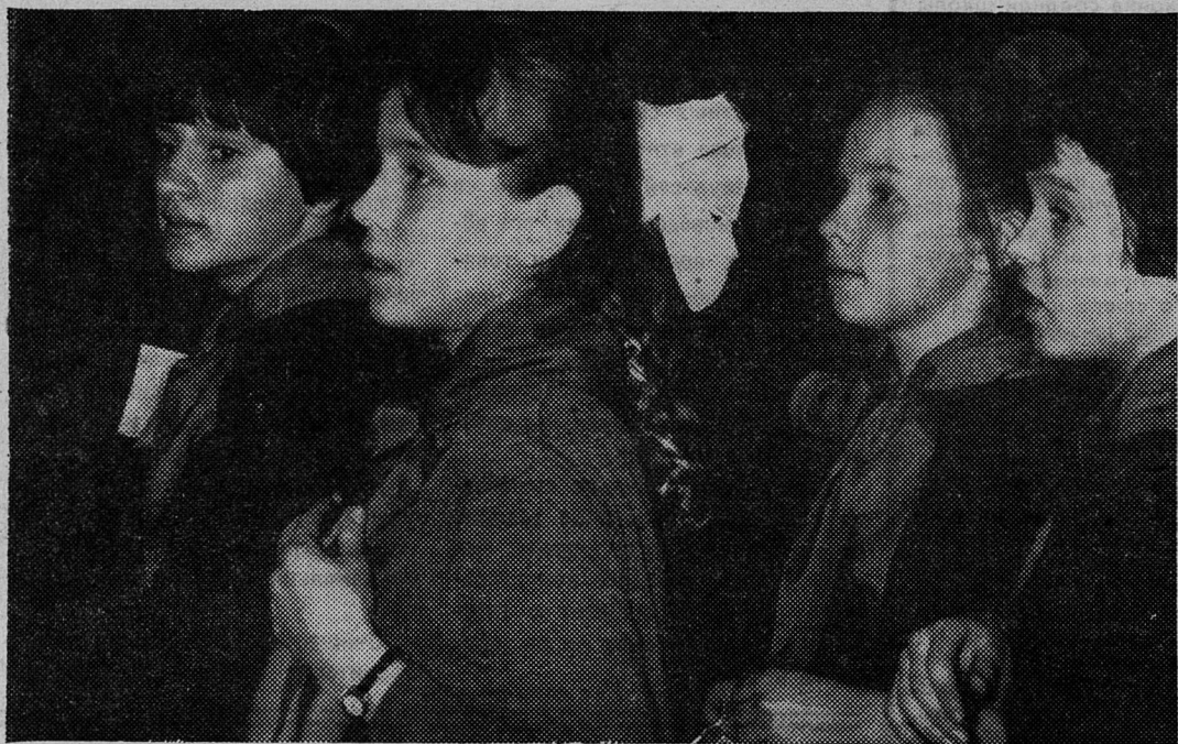
НА ФОТОКОНКУРС БОЛЕЛЬЩИКИ.