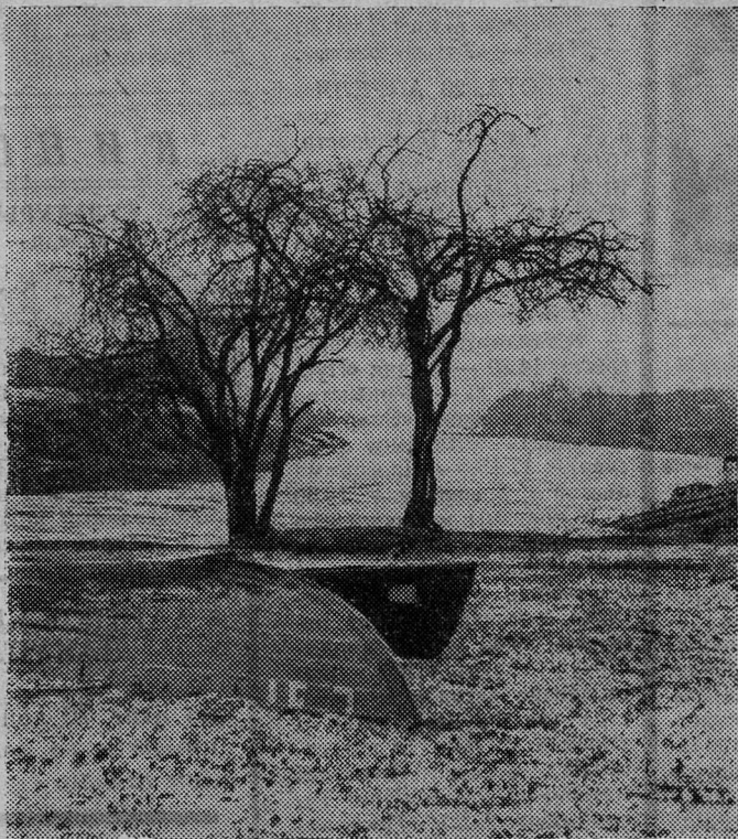
ВЕСНА НА ПЛЮССЕ.