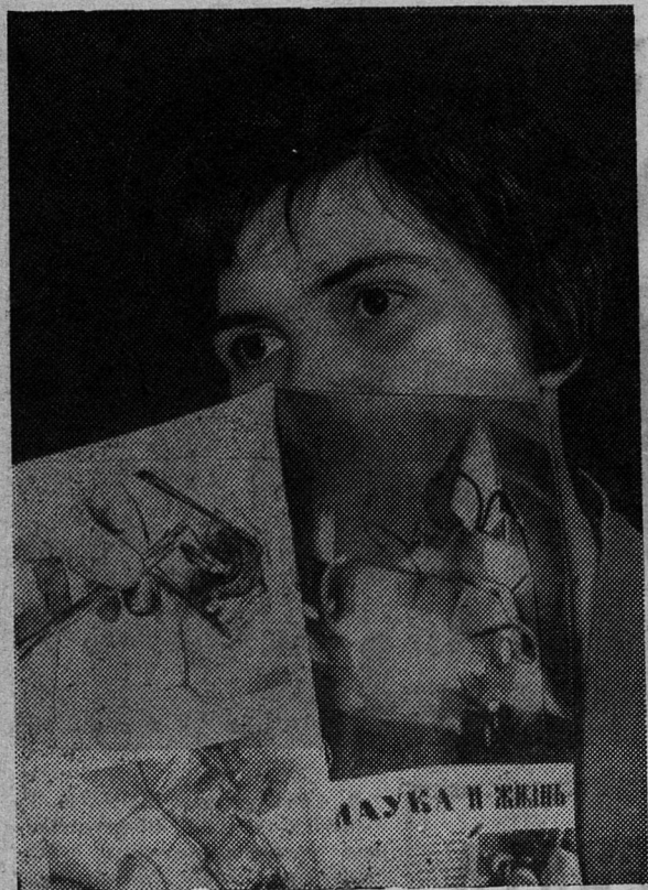
М Е Ч Т А.