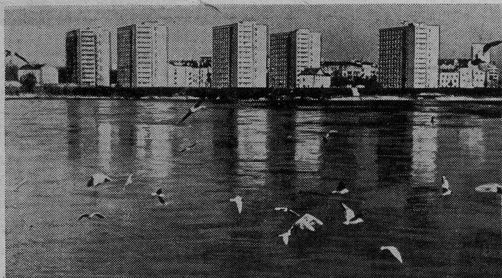
Новые жилые дома на правом берегу Вислы в Варшаве.