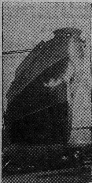
Польская Народная Республика. В Гдыне на три месяца раньше срока построено грузовое судно «Галсы». Оно предназначено для Советского Союза.

Не стану утомлять читателя долгим рассказом о том, что испытывали при этом жильцы квартиры. Я больше не мог нормально заниматься обычными делами. Окончив работу, я уже не спешил, как прежде, домой. Еще у подъезда своего дома я слышал дикий вой джаза, безобидные раньше, но ставшие теперь ненавистными слова песенки и топот