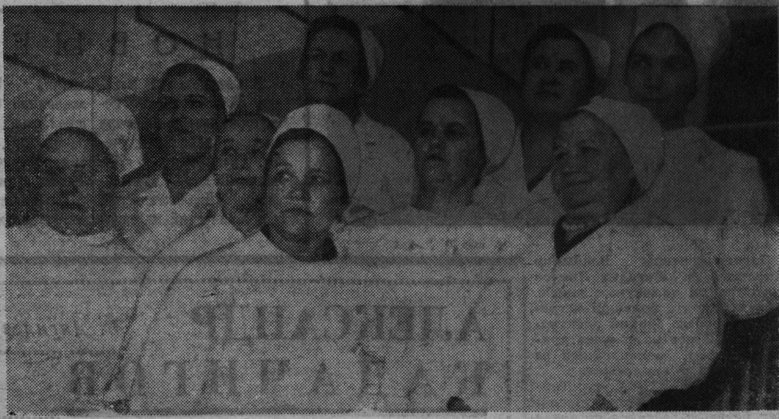
Всегда стоят на страже здоровья работники первой районной больницы.

Координационно-вычислительный центр ведет обработку поступающей информации.